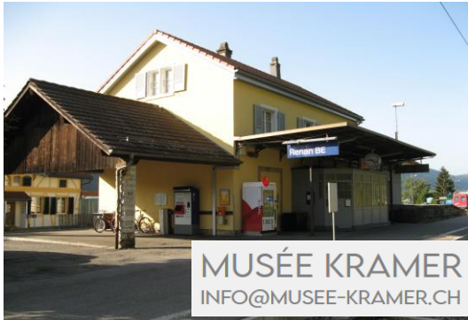
MUSÉE KRAMER INFO@MUSEE-KRAMER.CH